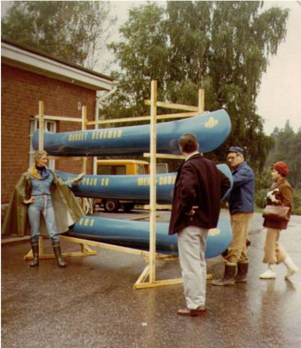
Här demonstreras de nyanskaffade kanoterna på Karisdagen 1978.