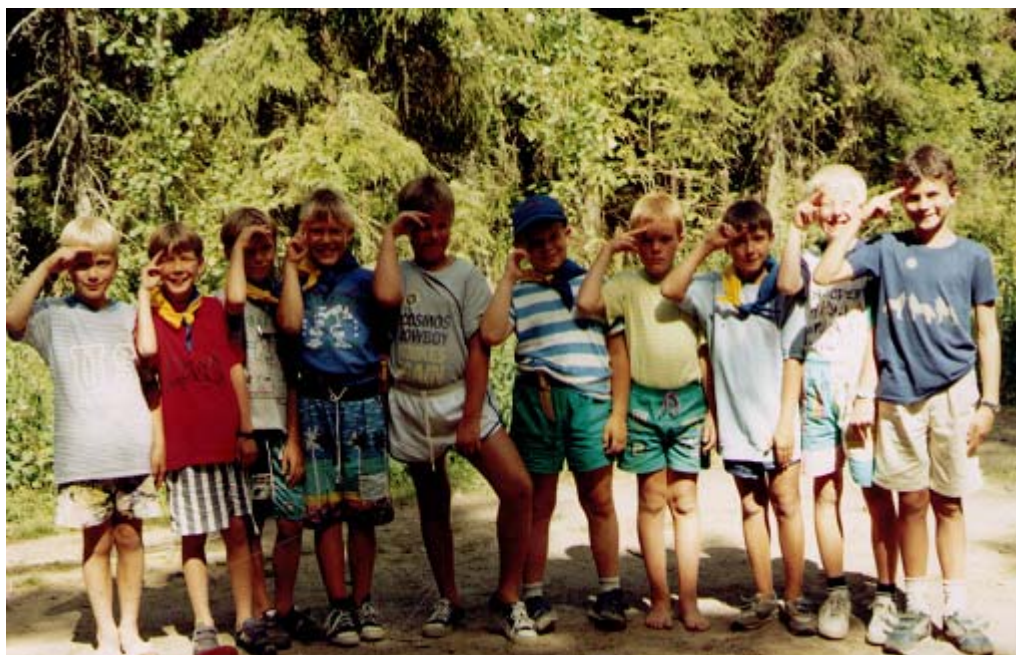
Alltid redo! Glada miner på KUL-92.