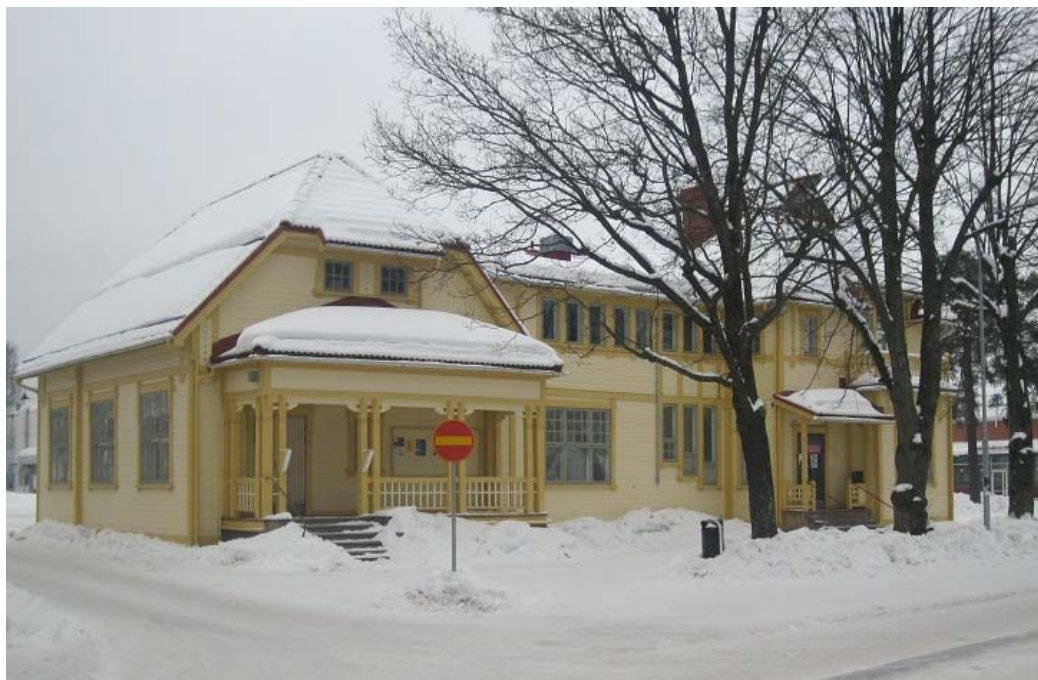
Villa Haga, kårens hemvist sedan 1993.

Villa Haga var både utvändigt och invändigt i dåligt skick så det var egentligen bara en tidsfråga innan kåren skulle bli tvungen att flytta undan en renovering. Detta skedde i september 2006. Ersättande utrymmen hittade kåren i f.d. Katarinahemmet. Ett drygt år senare var det dags för kåren att flytta tillbaka till Villa Haga där man fick disponera över ett rum tillsammans med Karis Flickorna.