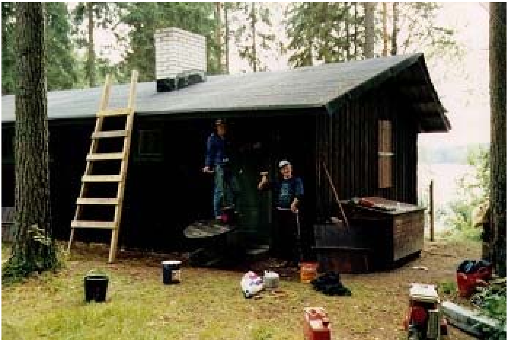
Äldre medlemmar utför reparationsarbeten på Granhyddan 1985.

Stugan blev genast en omtyckt och naturligt ställe för läger, hajker och utfärder för scoutgrupper i alla åldrar. Längs med åren har det ständigt gjorts förbättringar på stugan och näromgivningen, t.ex. det år 2007 byggda skjulet för kårens kanoter vilkas antal idag har ökat från ursprungliga fyra till åtta. Byggandet av skjulet möjliggjordes av ett stipendium på 500 euro från Karis Rotary. Lägerområdet i Hållsnäs var ju en naturlig uppbevaringsplats för kanoterna tack vare den omedelbara närheten av vatten. Till den regelbundna underhållsverksamheten hörde också ved- och städtalkon.