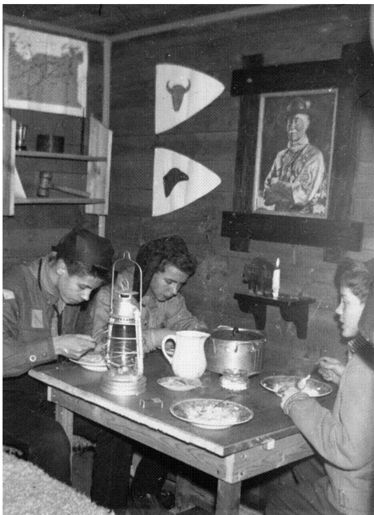
Patrull Björnens julfest 1957 i deras egen lya.

Patrullerna förde egna dagböcker över sina möten, en del mycket utförligt med illustrerande teckningar och andra mer anspråkslöst, som kan bjuda på en hel del intressant läsning. Här t.ex. intagningsceremonin för patrull Älgen från 1950: