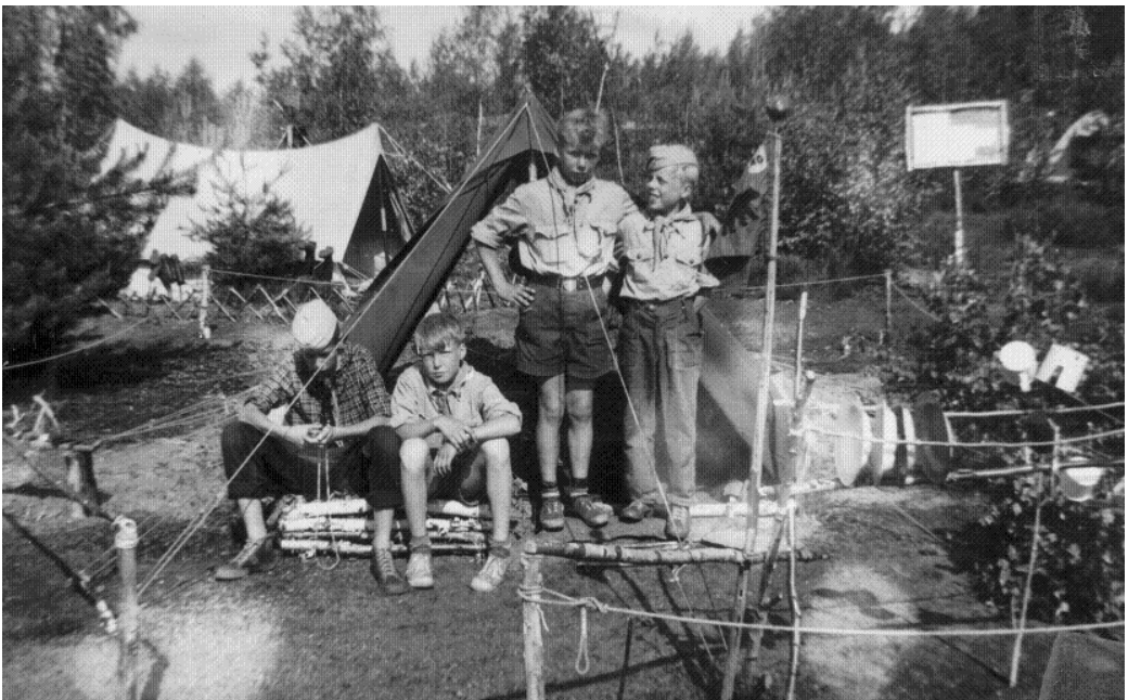
Bilder på patrull Björnen på läger i Lappvik 1956.