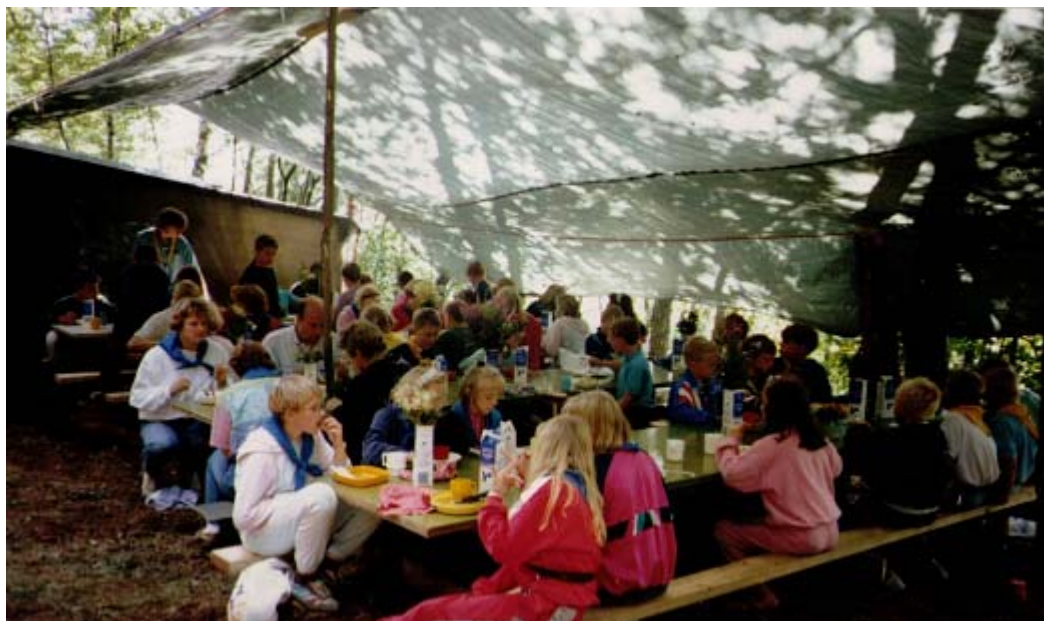
KG-80. Förevisande: alla lägers centrum, nämligen matsalen.