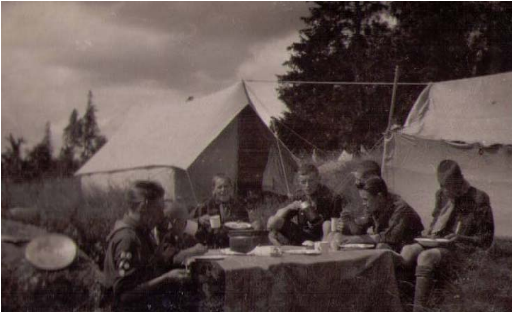
.Läger i Botby, Helsingfors, 1924.