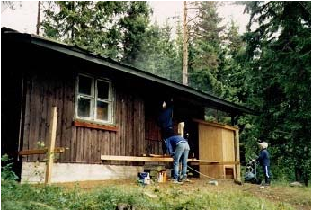
Samma byggnadsarbeten 1985.

Vargungeflocken samlades i början av 1980-talet i Tallmo där staden upplät ett hobbyrum för scouternas användning. Ibland blev det så pass trångt att man var tvungna att flytta andra tillfälliga utrymmen, t.ex. till finska högstadiet på Ekenäsvägen.