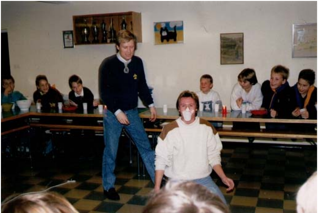
Julfestprogram, slutet av 1980-talet.