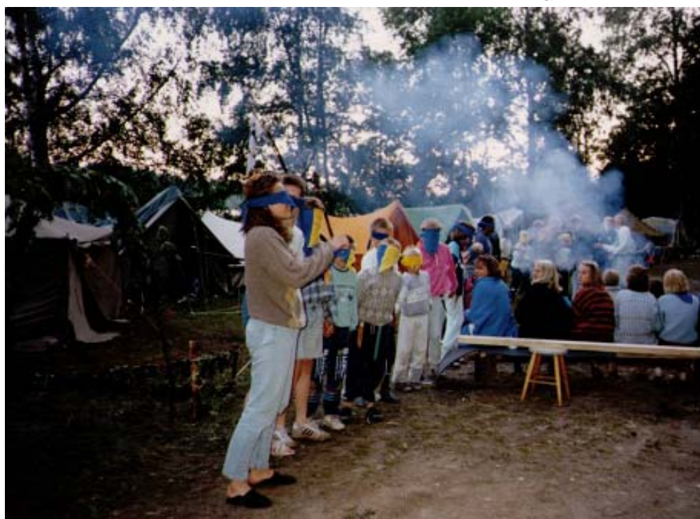
Gammal lägertradition igång på KG-80: lägerdop!