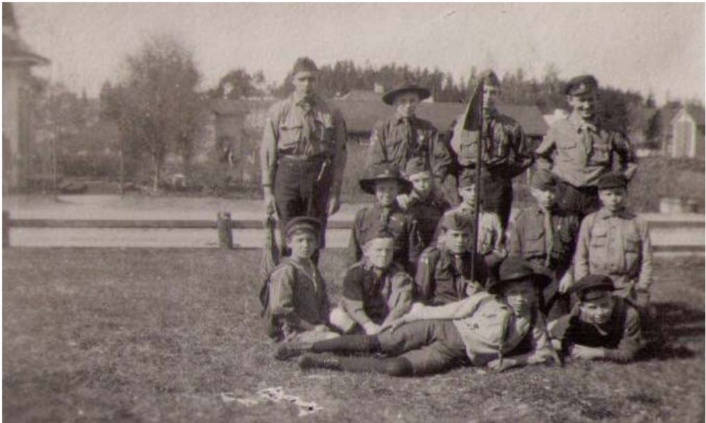
Ytterligare en patrullbild från 1925.