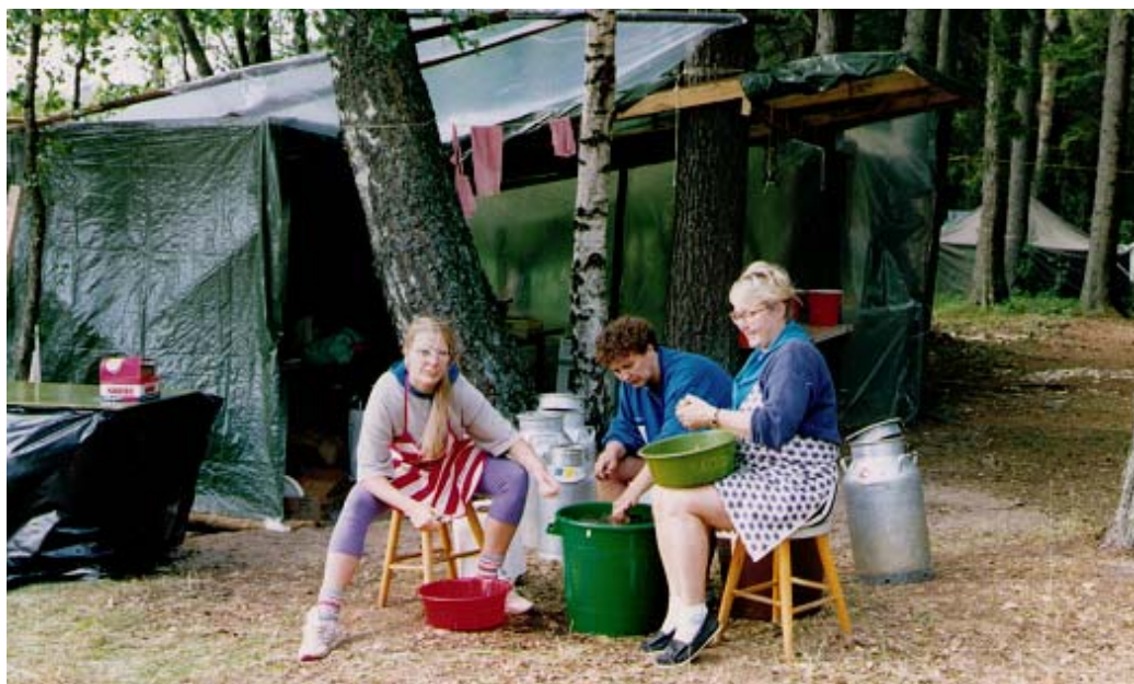
Kluck-93: den ovärderliga kökspersonalen!