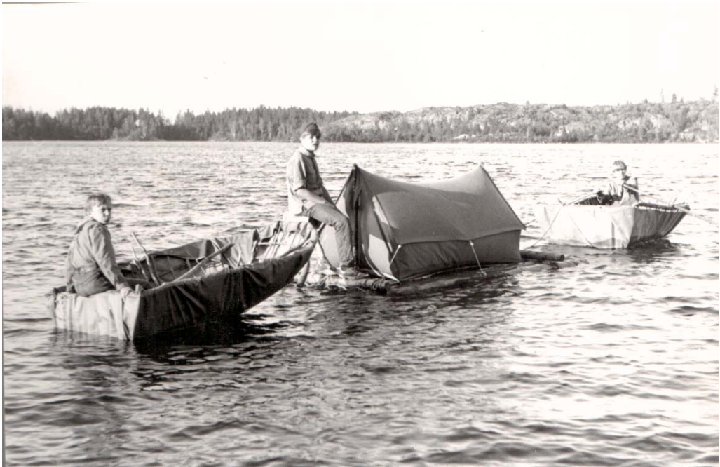
Ibland urartade (och urartar) sig byggandet en smula?!