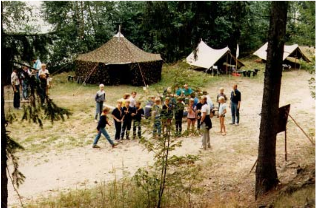
Sommarläger 1986: vargungarna ställer upp på besöksdagen.