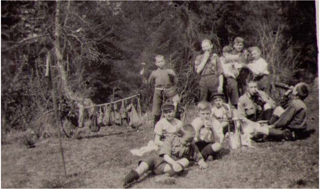
Utfärd till Dönsby sommaren 1925.