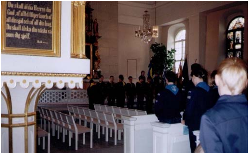
Dubbnig i Ekenäs kyrka 1999.