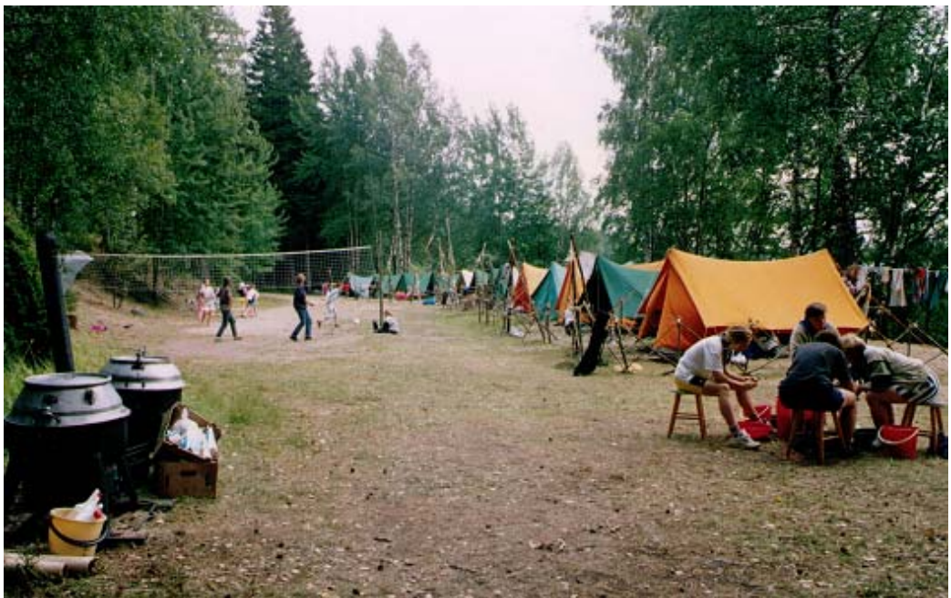
En lägervy från KUL-92; under 90-talet var stranden vid Granhyddan ofta fullsmockad av tält när det var sommarläger.