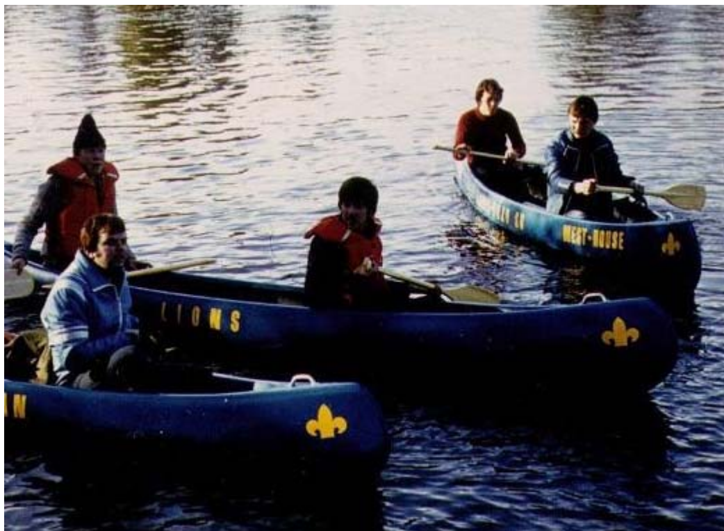
Kanotutfärd i Svartån 1979.

Till de mera utmanande evenemangen som har stått inom kårens regi hör I-klassvandringen och ”Olga i Naturen”. I-klassvandringen var gemensamt för alla scouter i Finland före det s.k. nya programmet infördes, då klassindelningen från tredje- till förstaklassscout å sin sida avvecklades. I-klassvandringen var ämnad som en ”slutexamination” för II-klassscouter aspirerande till I-klass, och inbegrep en längre vandring med krävande orientering och svårare delmoment och kontroller som krävde att alla inlärd färdigheter skulle sättas på prov. Vandringen skedde oftast i par och som avslutning skulle paret/patrullen författa en rapport över sin vandring. Tack vare detta krav har vi idag till exempel följande strapatser, begångna i slutet av april 1987: