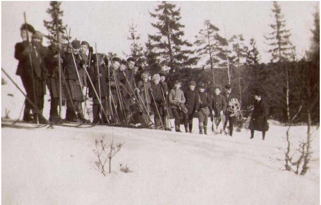
Skidutfärd till Dönsbybergen, mitten av 1920-talet.